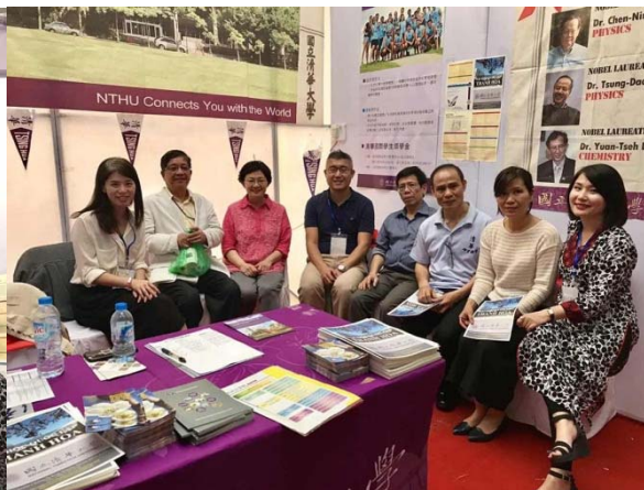
圖十一：本校代表團與河內傑出校友合照