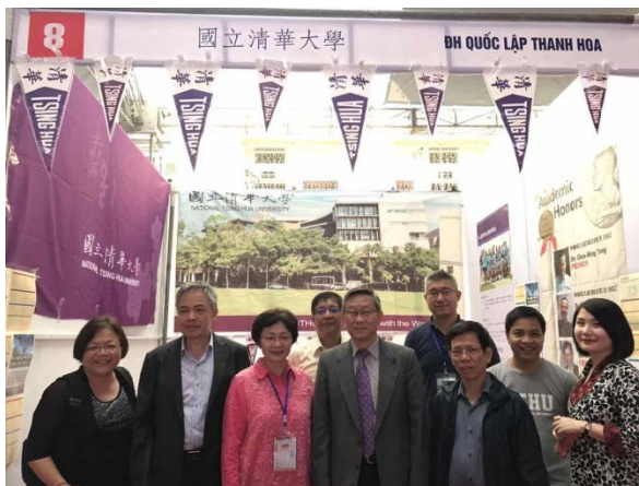
圖十：本校代表團與賀陳校長合照