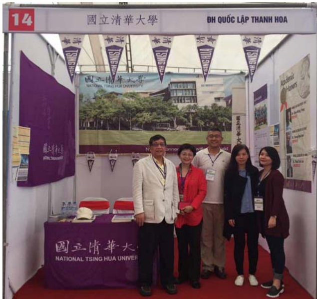
圖六：本校代表團於攤位合照