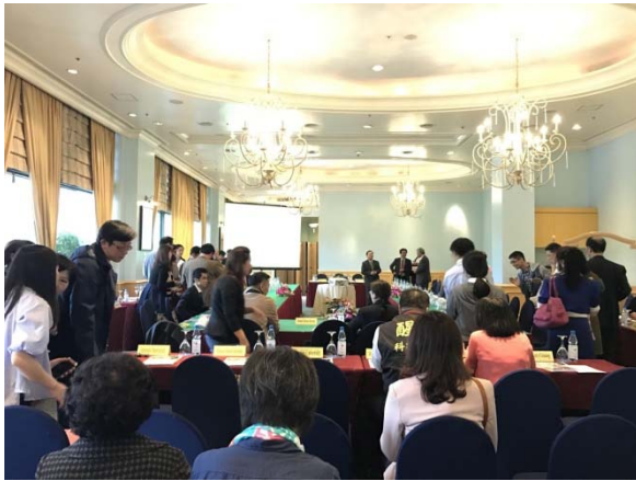
圖一：臺越學術交流座談會