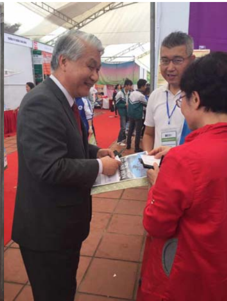
圖七：駐越南代表處石大使訪問本校攤位