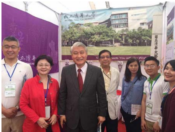
圖八：本校代表團與駐越代表處石大使合照