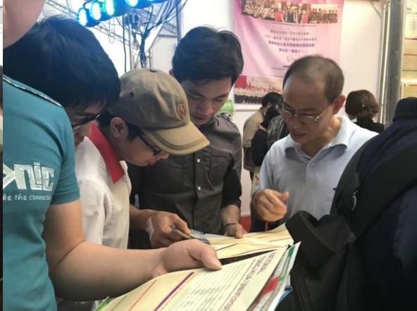
圖四：清大越南校友向學生分析科系資訊