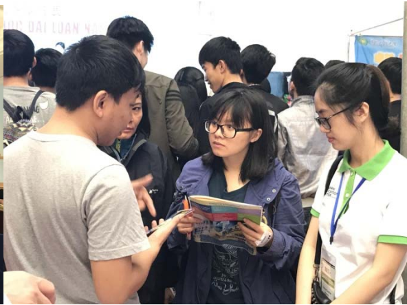
圖二：教育展攤位越南學生詢問入學資訊